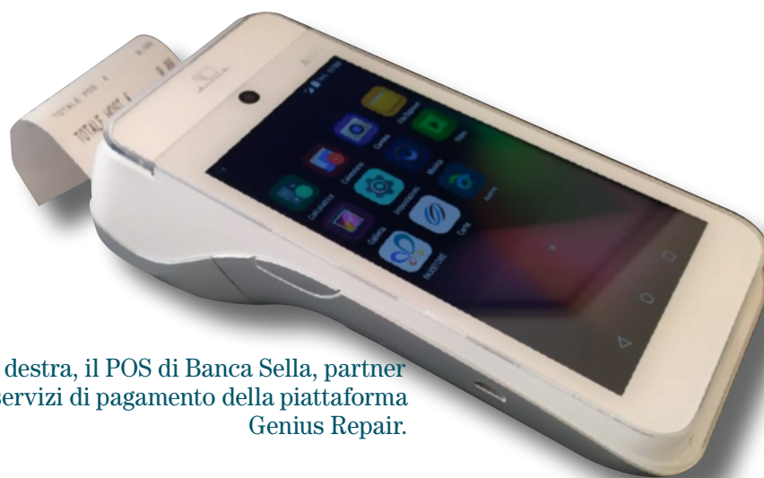
Qui a destra, il POS di Banca Sella, partner per i servizi di pagamento della piattaforma Genius Repair.

con Banca Sella, tutta la filiera viene retribuita in tempo reale: ossia il negoziante, il laboratorio e la piattaforma Genius". Il punto vendita riceve immediatamente il